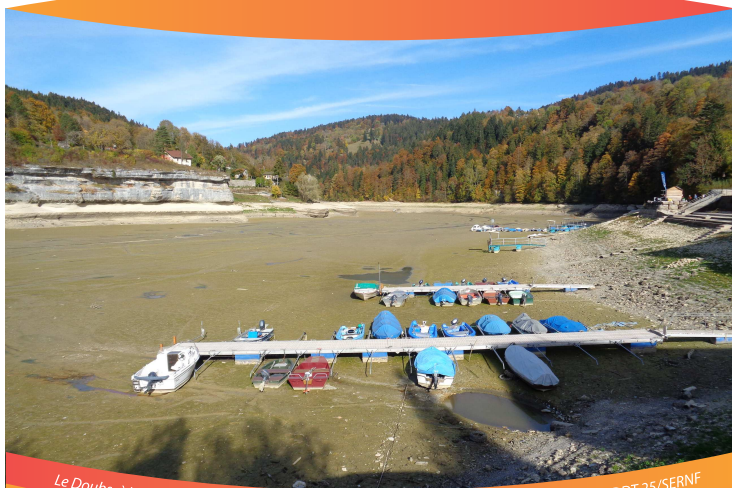
Le Doubs à Villers le Lac (10/2018)

Économiser l'eau, c'est protéger la ressource mais c'est aussi réduire ses dépenses