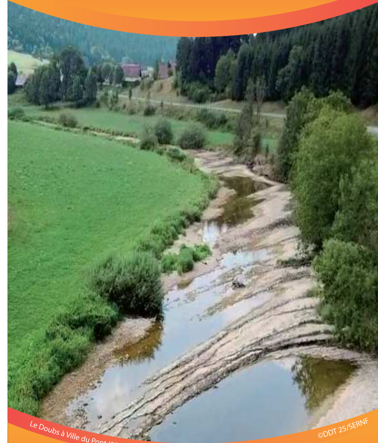
Le Doubs à Ville du Pont (09/2018)