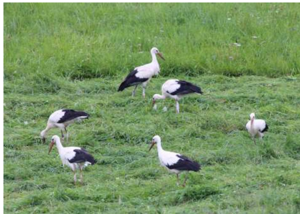
Migration des cigognes en août 2021

Au vu des nouvelles règles sanitaires que nous vivons actuellement, la municipalité se voit obligée d'annuler sa traditionnelle présentation des vœux et s'en excuse auprès de la population.