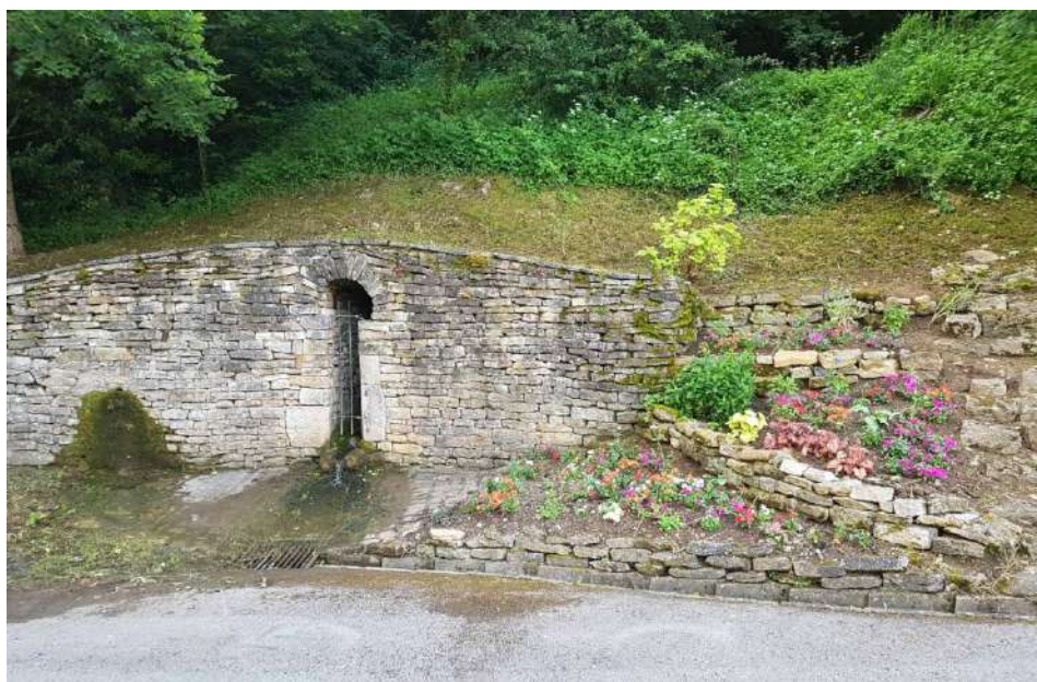
Source dans le quartier de Vaux

► De nouveaux créneaux horaires d'ouverture de la mairie au public sont proposés : les lundis et mercredis la plage horaire est étendue jusqu'à 19h durant une période d'essai de 2 mois.