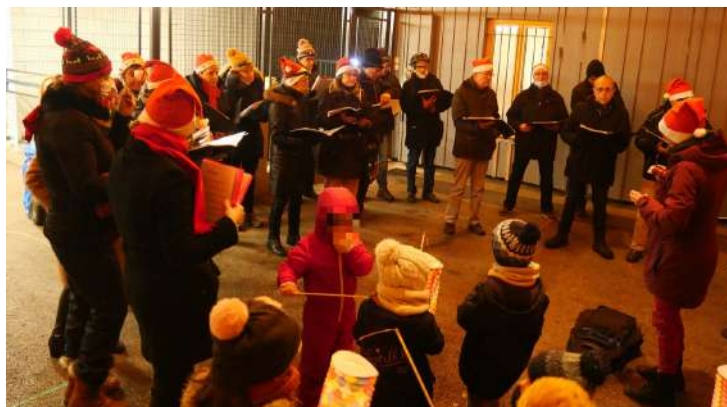
Chorale de l'Emica

Enfin, vous pouviez emporter des barquettes de tartiflette cuisinée avec les pommes de terre plantées au printemps sur la future parcelle des jardins partagés.